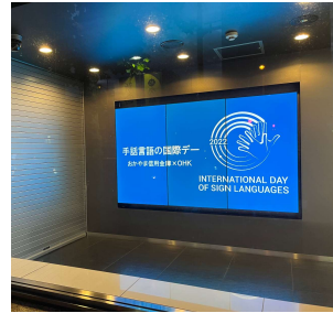
おかやま信用金庫本店