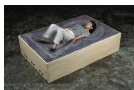
岡本高幸 / ころける身体-古墳をひっくり返す