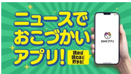
※新CMクリエイティブ

今後とも、ユーザーに選ばれ続けるアプリとして、ユーザーの求める価値に沿いながら競合サービスが模倣困難な機能を拡充していき、テレビビジネスを支える重要なメディアとして成長させていく所存です。